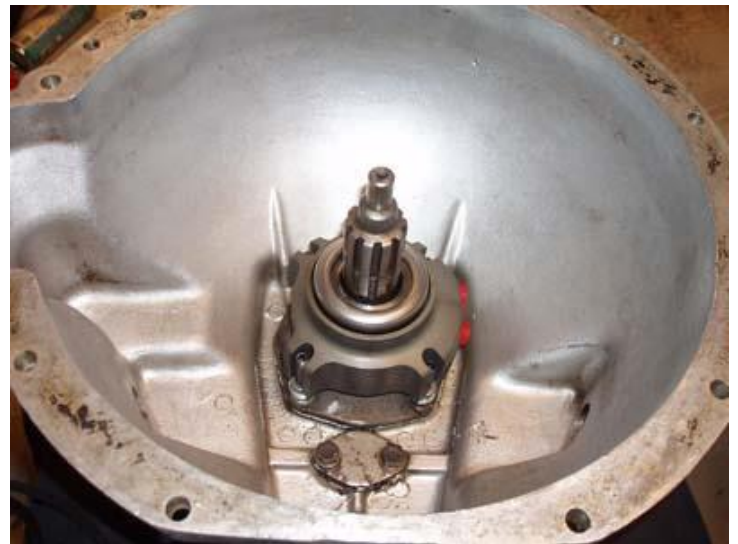
Summit Racings Hydraliska koppling på plats