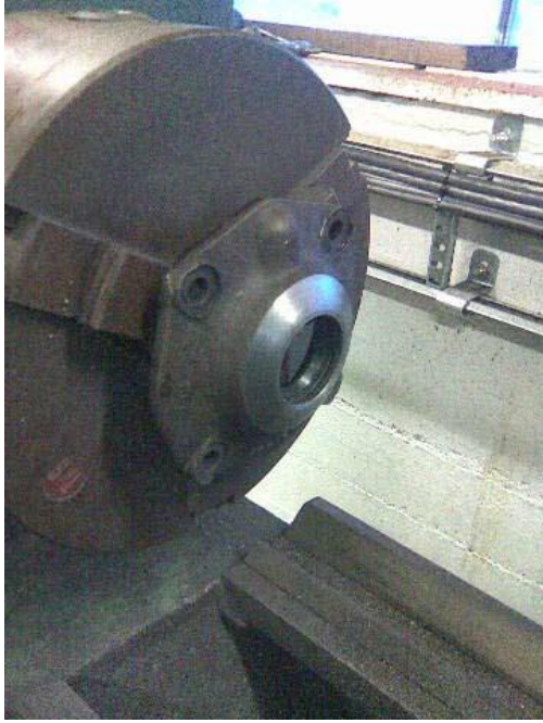
Front cover i svarven