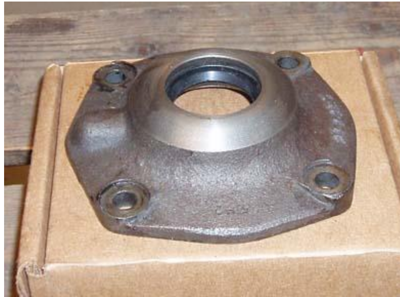
Front Cover med kapa topp