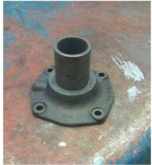
Front cover i originalskick