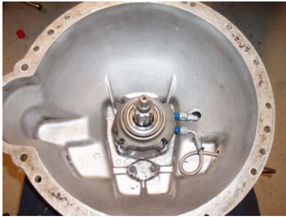
Allt klart. Här syns även den flexibla slangen.