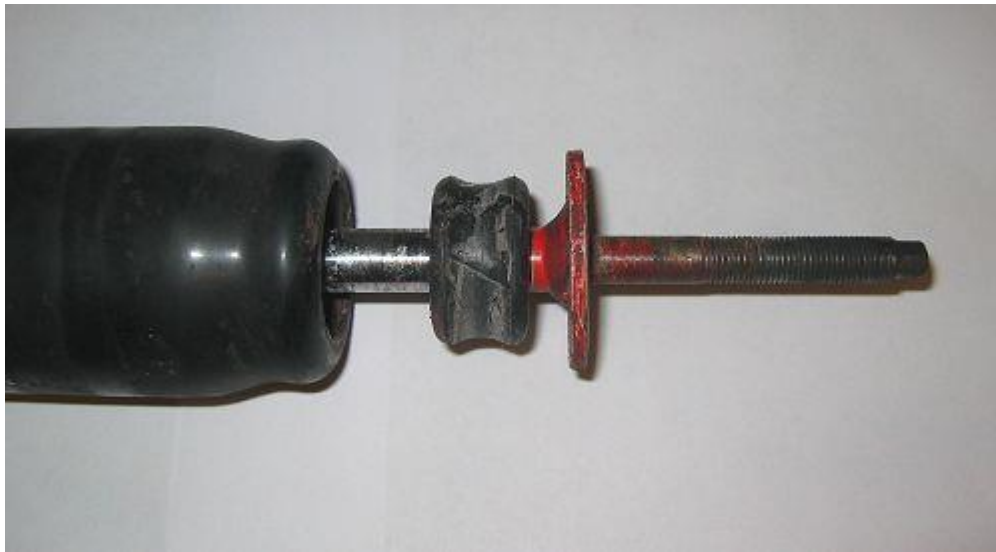
AVO-stötdämpare med original Bump Stop. ca 18 mm i orginal.

Se montaget på bilderna. OBS! På samtliga bilder är dammskyddet nerkränkt. Normal sitter bump-stop och metallkragen under dammskyddet.