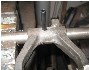
5 mm:s rörpinne.