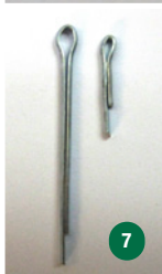
1. Mätarens framsida 2. Mätarens baksida 3. Mätarens innehåll 4. Det relativa raka kopparöret 5. Dags att slipa bort rörets grader 6. Mackapären med isolering, hål och saxpinne 7. Lagom längd från originalet 8. På plats sett från baksidan till höger 9. På plats och klar för montering 10. Sprängskiss från katalogen 11. Detaljbild på "Mackapären"; nr 2 12. "Originalmackapären" från uppfinnaren och tillika TR-proflen från Klägghult